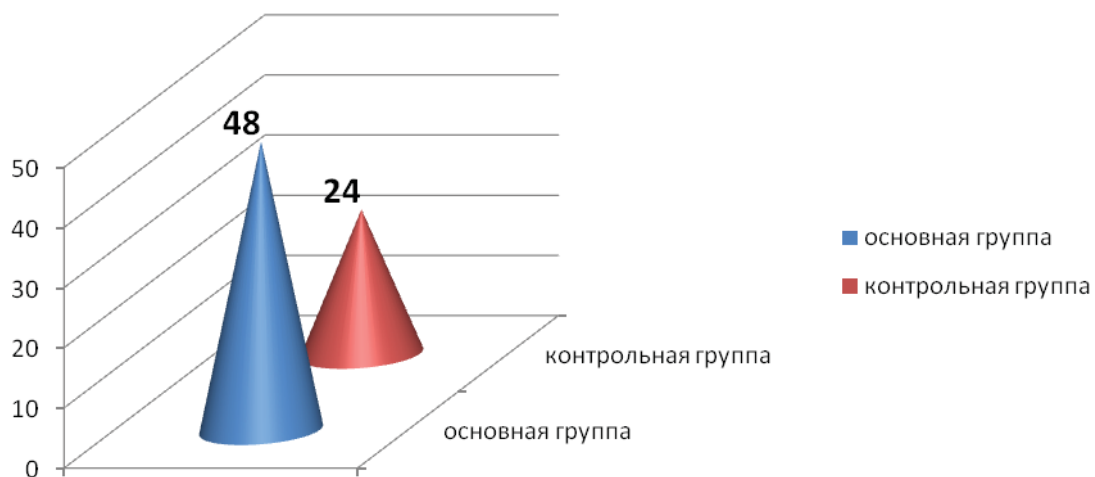
Рис. 2 Сравнение эффективности проведенной терапии у пациенток основной и контрольной групп.

В предыдущих лечебных циклах толщина эндометрия у наблюдаемых пациенток на момент ПЭ не превышала 3-5 мм, и были выраженные нарушения показателей маточной гемодинамики. Эти пациентки были толерантны к ранее проводимой общепринятой подготовительной терапии. После проведенного лечения у пациенток основной группы на момент ПЭ толщина эндометрия составляла 8-10 мм. При доплерометрическом исследовании отмечено снижение индекса резистентности в маточных и мелких радиальных артериях и повышение конечной диастолической скорости кровотока. Частота наступления беременности у пациенток основной группы составила 48%, тогда как у пациенток контрольной группы – 24% (рис. 2).